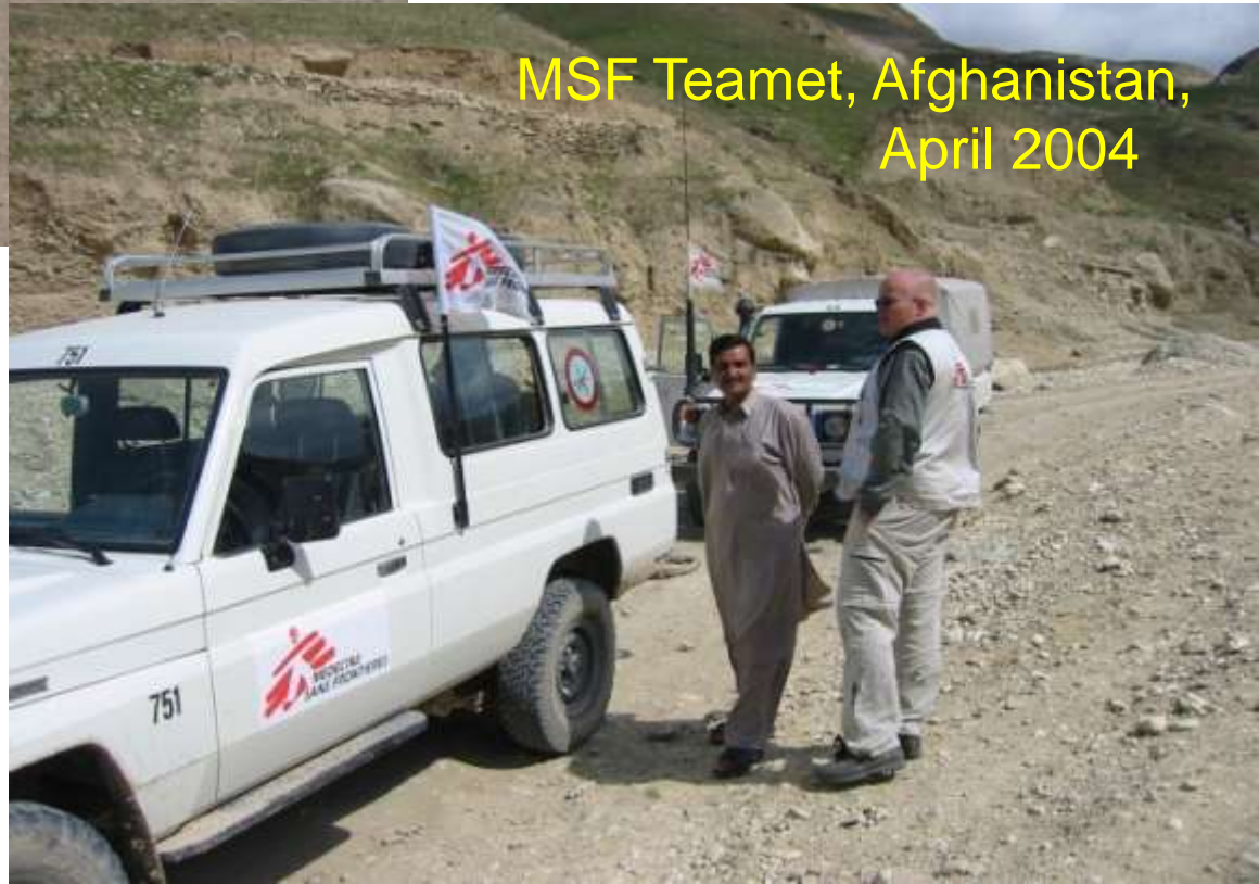
MSF Teamet, Afghanistan, April 2004