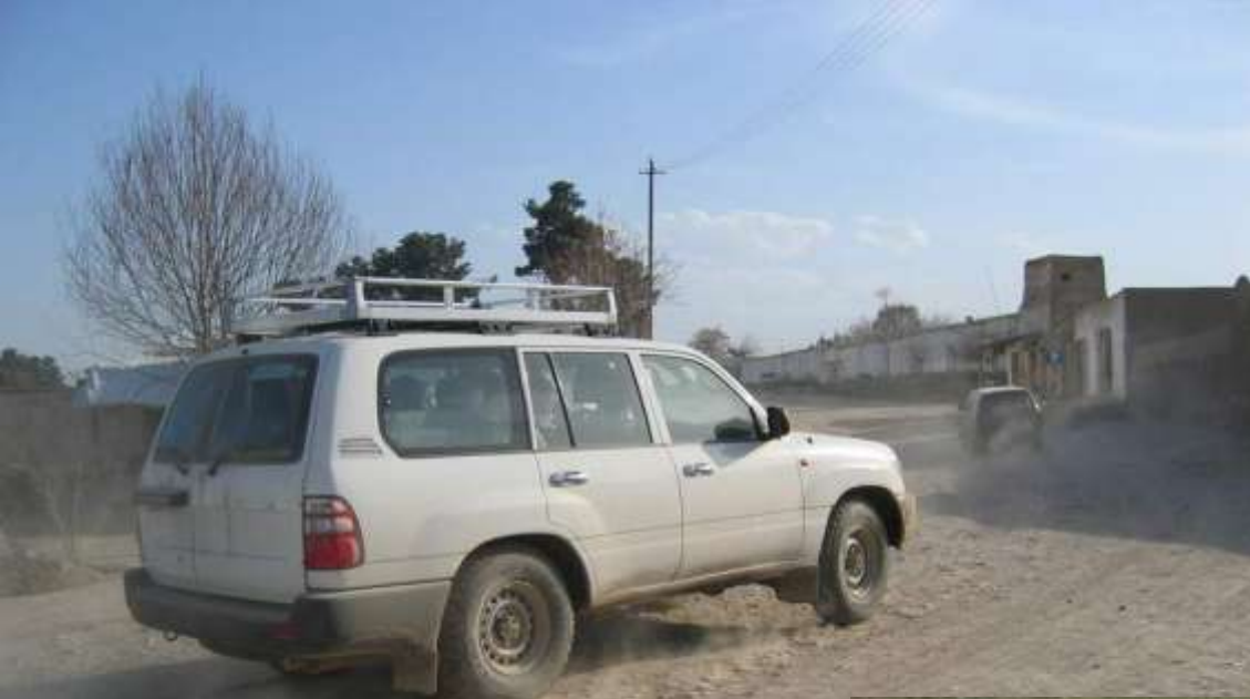
PRT Soldater, Afghanistan, April 2004