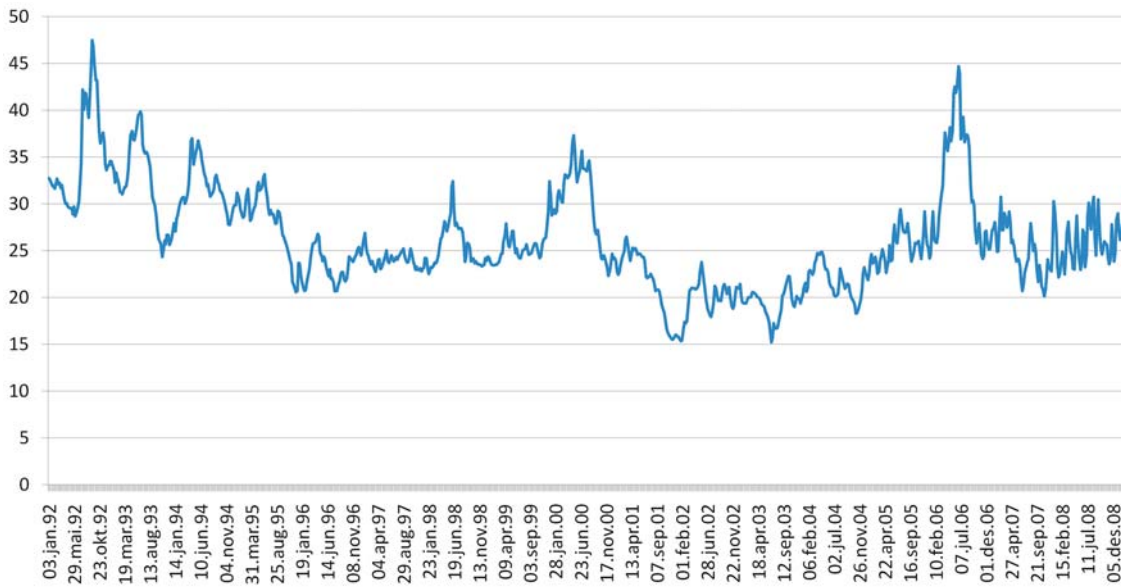
FIGUR 1 Gjennomsnittlig laksepris jan. 92 – mars 09.

Ved inngangen til 2005 ble førkvotene og ordningen med konsesjonsvolum erstattet med dagens MTB-ordning. En konsesjon som frem til da gav rett til å produsere fisk på 12 000 m 2 vann, med en bestemt mengde fôr, fikk nå fri tilgang på fôr og vann, men hver tillatelse fikk i det nye systemet kun lov til å ha maks 780 tonn fisk i merdene til enhver tid.