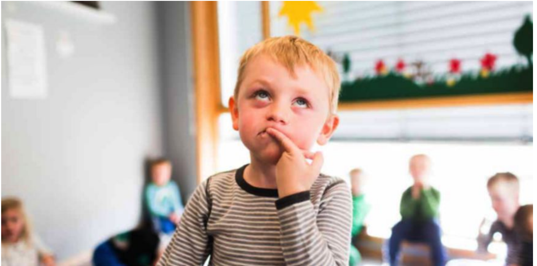
Agderprosjektet skal gjennom økt voksenkontakt, lek og medvirkning stimulere tallforståelse, språk, selvregulering og sosiale ferdigheter hos femåringer i barnehagen, skriver artikkelforfatterne.