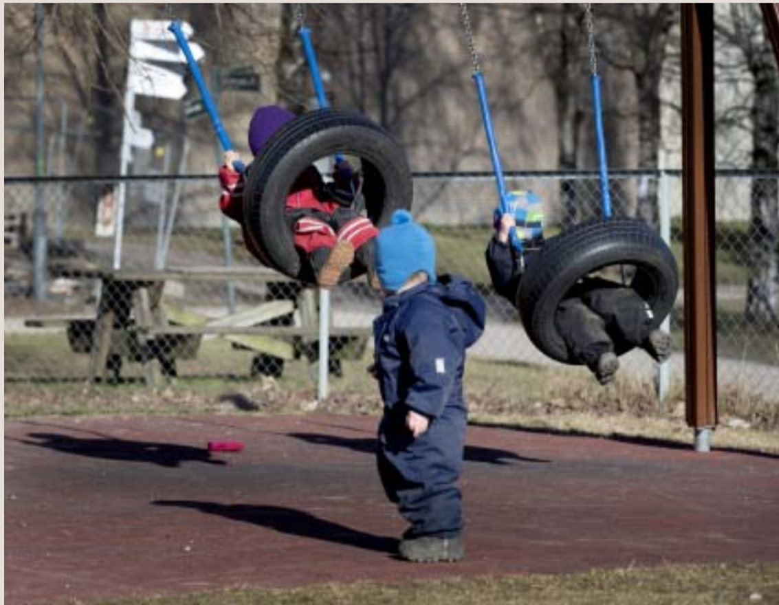
Det er spesielt viktig å stimulere sosiale ferdigheter, selvregulering, språk og matematikk allerede i barnehagen, for å gi barn bedre muligheter til å lykkes faglig og sosialt på skolen, skriver artikkelforfatteren.

Internasjonal forskning gir oss også innsikt i hva som er viktig pedagogisk innhold i barnehagen. Det er spesielt viktig å stimulere sosiale ferdigheter, selvregulering, språk og matematikk allerede i barnehagen, for å gi barn bedre muligheter til å lykkes faglig og sosialt på skolen. Studier viser også at i denne alderen lærer ikke barn godt av å jobbe med oppgaveark eller av instruksjon (det gjelder faktisk også mange barn i første klasse); De lærer best gjennom en kombinasjon av fri lek og veiledet lek. I veiledet lek deltar barna i lekbaserte læringsaktiviteter planlagt og ledet av voksne. Barns deltagelse, engasjement og medvirkning er viktig i veiledet lek, og det er også avgjørende at barna opplever