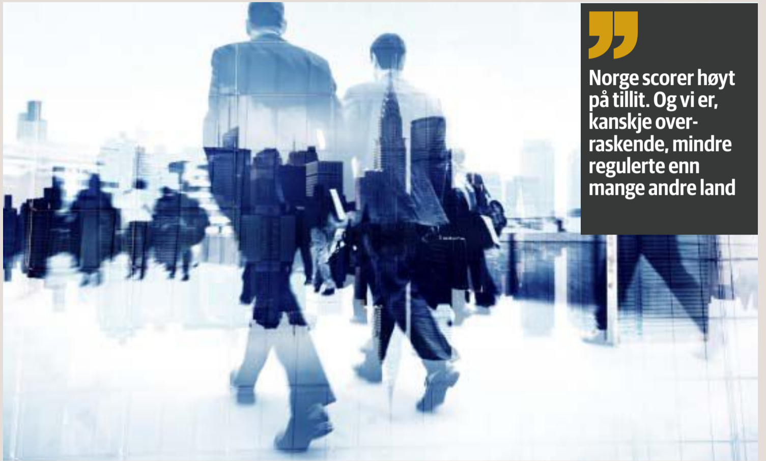
Jo mer gjennomregulert samfunnet er, jo mindre trenger vi å basere vår samhandling på tillit. Vi investerer derfor mindre i det sosiologene kaller «sosial kapital»: Frivillige organisasjoner, våre venner og våre nettverk; vi trenger dem mindre når staten blir større.